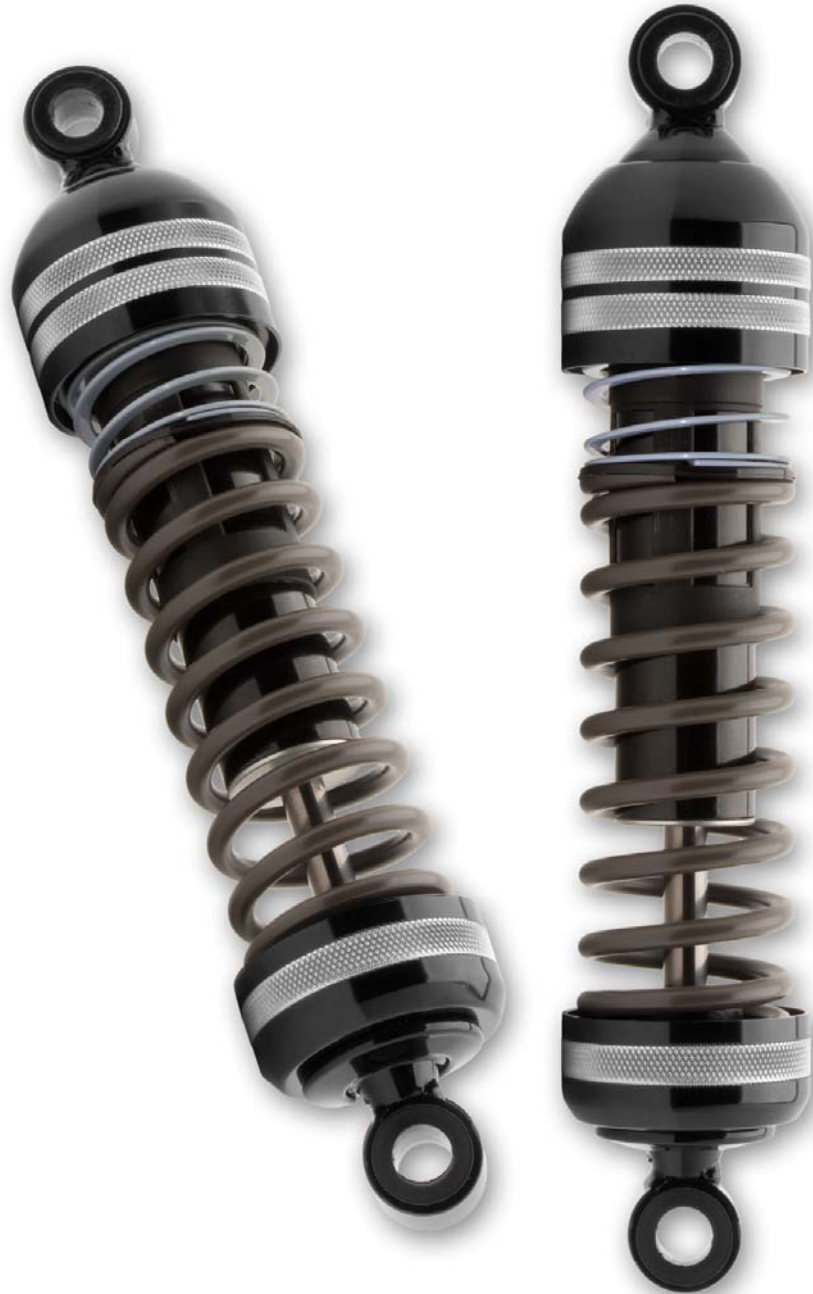
Stoßdämpfer Progressive Suspension Typ 940